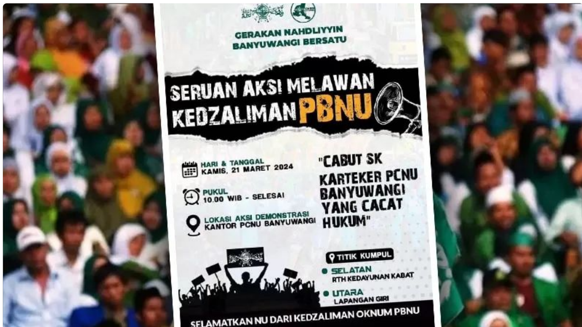
(Seruan ajakan demo yang beredar)

Ajakan demonstrasi tersebut sudah menyebar melalui media sosial dan player di grup-grup WhatsApp pengurus ranting dan MWC NU. Dari informasi di internal PCNU Banyuwangi demisioner, terbitnya Surat Pengesahan Pengurus Besar Nahdlatul Ulama (PBNU) nomor 311/PB.01/A.II.01.45/99/03/2024 tentang penunjukkan Karteker PCNU Kabupaten Banyuwangi dinilai cacat prosedur dan janggal.