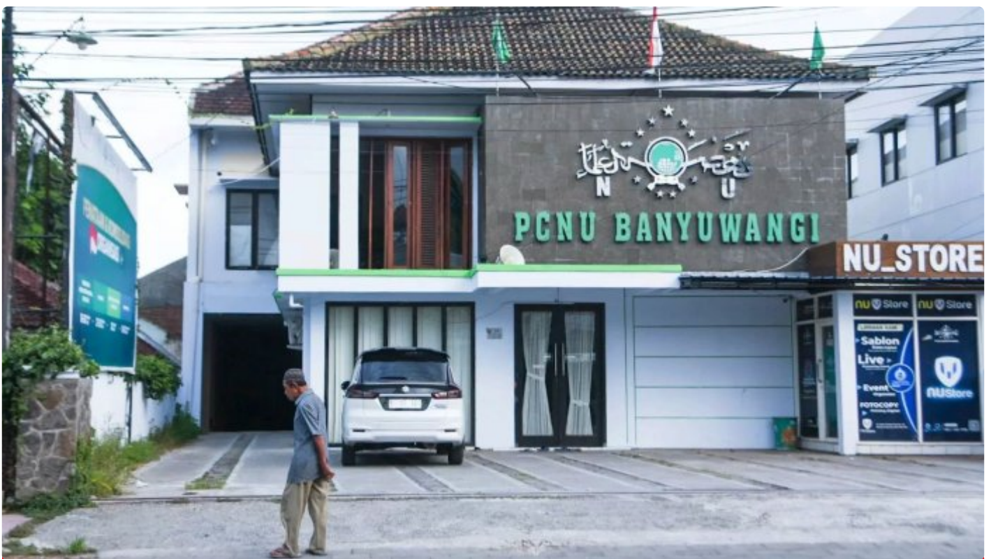
Kantor PCNU Banyuwangi

BANYUWANGI - Terbitnya SK kepengurusan karteker PCNU Banyuwangi menuai pro dan kontra di kalangan warga Nahdliyin Banyuwangi. Pihak kontra karteker bahkan berencana melakukan aksi penolakan putusan PBNU di kantor PCNU Banyuwangi pada Kamis 21 Maret 2024 mendatang.